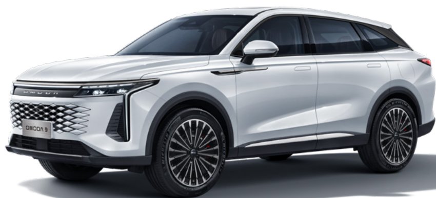
STAR WHITE - lakier metalizowany Bez dopłaty