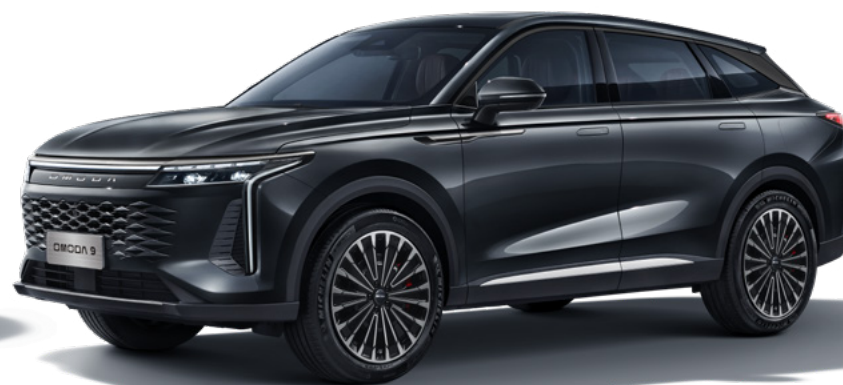
INK BLACK - lakier metalizowany Bez dopłaty