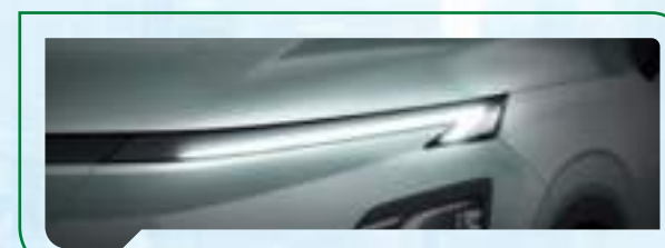
Światła do jazdy dziennej LED

Światła do jazdy dziennej LED w kształcie litery „T” oraz reflektory LED zapewniają lepszą widoczność, a tylne światła z unikalnym efektem 3D podkreślają nowoczesny design pojazdu.