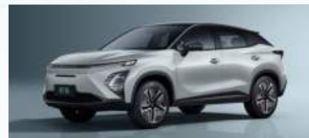
Aviation Silver z czarnym dachem (X4)