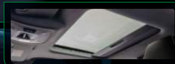
Otwierane okno dachowe