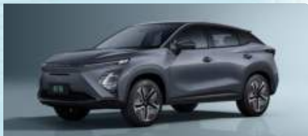
Phantom Gray (GV)