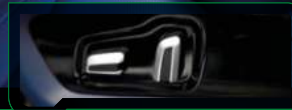
Elektrycznie regulowane fotele