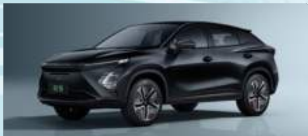
Carbon Black (CL)