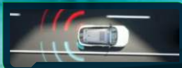
System monitorowania martwego pola