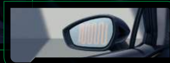
Elektrycznie składane, sterowane i podgrzewane lusterka