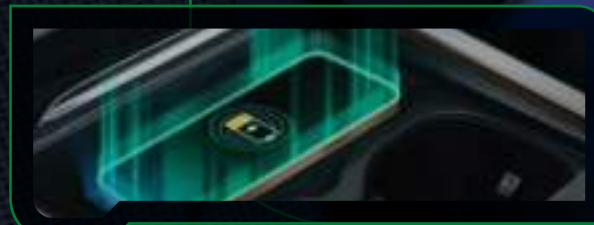
Ładowarka indukcyjna o mocy 50W