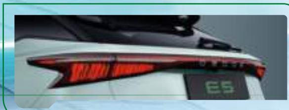
Tylne światła w technologii LED