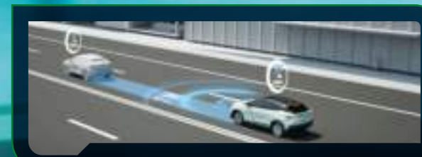
Inteligentny system unikania kolizji (ICS)