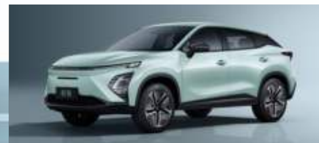
Aqua Green (SK)