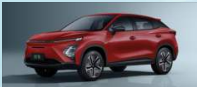
Blood Red (NL)