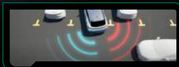
System ostrzegania przed kolizją podczas cofania

Omoda E5 - tak jak wersja z napędem spalinowym wyposażona jest w pełen zestaw zaawansowanych systemów od kontroli pasa ruchu, przez monitor martwego pola, po inteligentny tempomat adaptacyjny.