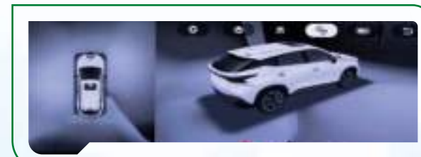
System kamer 540°

System kamer o kącie widzenia 540° uruchamia się automatycznie podczas cofania. Asystent parkowania obejmuje również czujniki parkowania z przodu i z tyłu oraz klasyczną kamerę cofania.