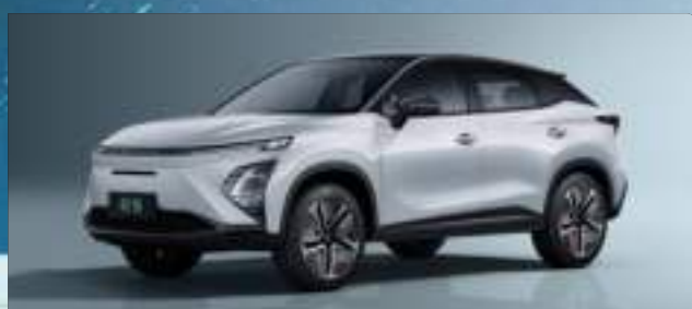
Khaki White z czarnym dachem (ZE)