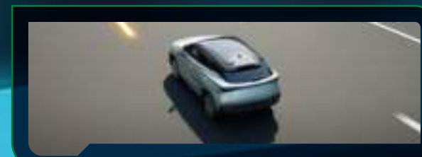
System ostrzegający o niezamierzonej zmianie pasa ruchu (LDW)