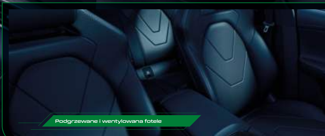
Podgrzewane i wentylowana fotele