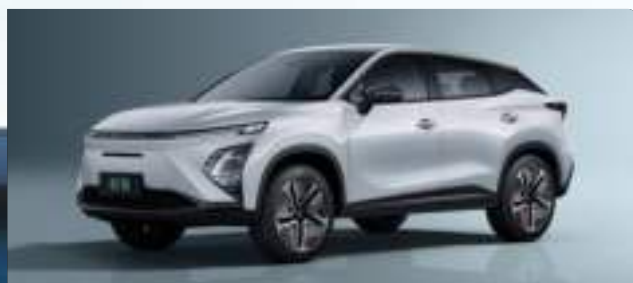
Khaki White (BW)