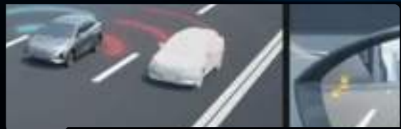
System monitorowania martwego pola