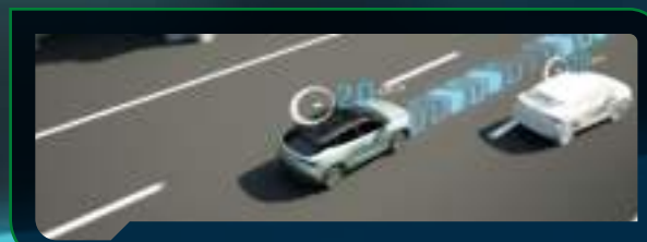
Asystent jazdy w korku