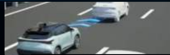
Tempomat adaptacyjny z funkcją utrzymywania na pasie ruchu (ACC)