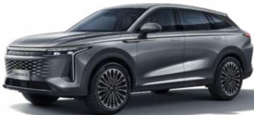
UNIVERSE GRAY - lakier matowy 5000 zł