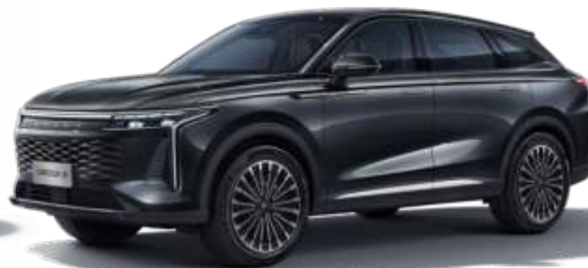
INK BLACK - lakier metalizowany Bez dopłaty