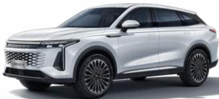
STAR WHITE - lakier metalizowany Bez dopłaty