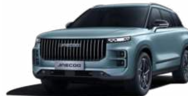
OLIVE GRAY (UD) - LAKIER METALIZOWANY