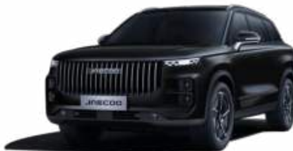
CARBON BLACK (CL) - LAKIER PERŁOWY

I co najważniejsze, bez względu na to, jaki kolor nadwozia wybierzesz - jest on bez dopłaty.