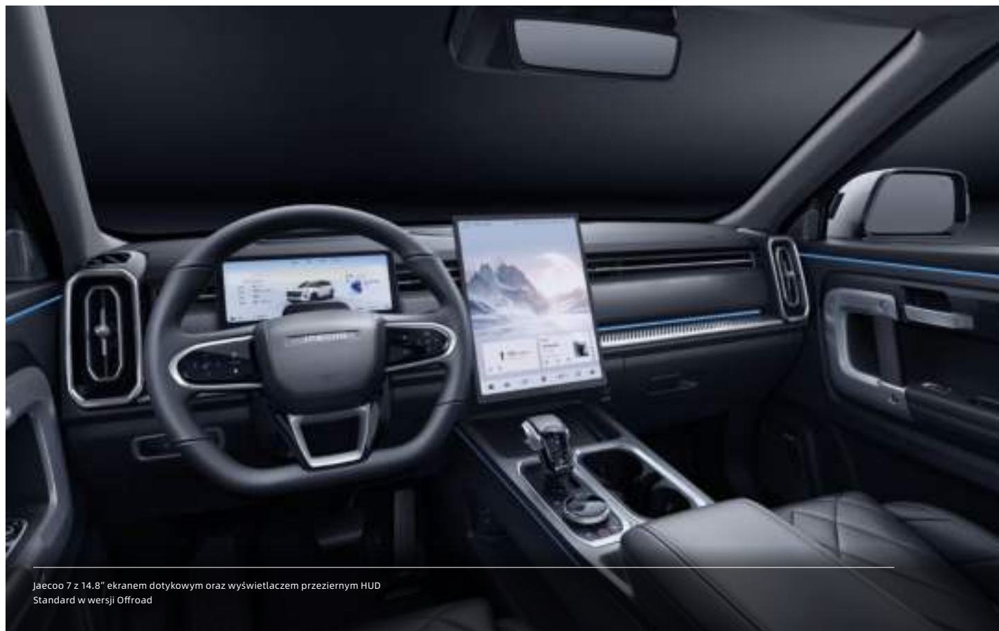
Jaecoo 7 z 14,8" ekranem dotykowym oraz wyświetlaczem przeziernym HUD Standard w wersji Offroad