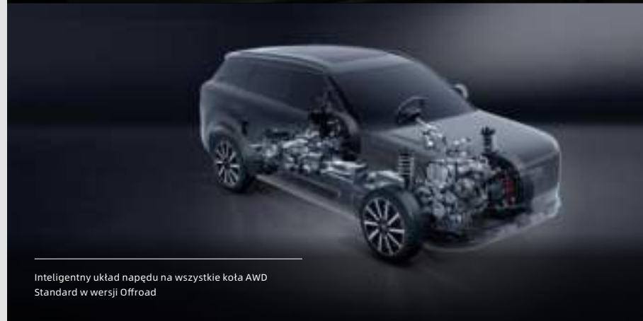
Inteligentny układ napędu na wszystkie koła AWD Standard w wersji Offroad