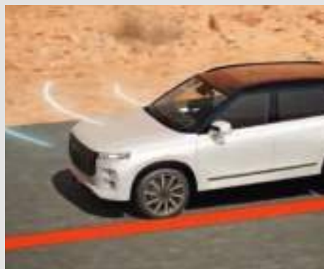
System zapobiegający niekontrolowanej zmianie pasa ruchu (LDP)