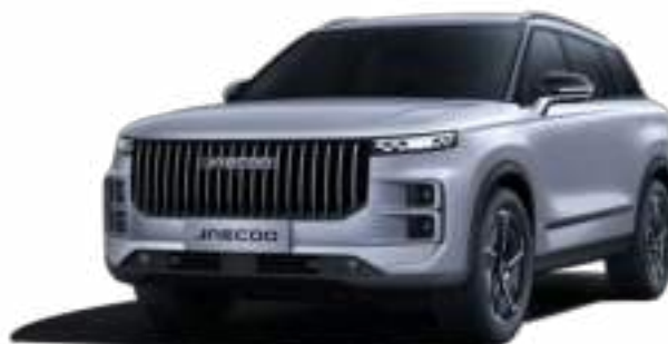
MOONLIGHT SILVER (KU) - LAKIER METALIZOWANY