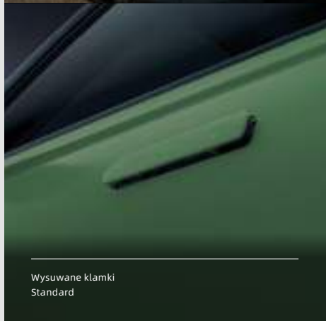
Wysuwane klamki Standard