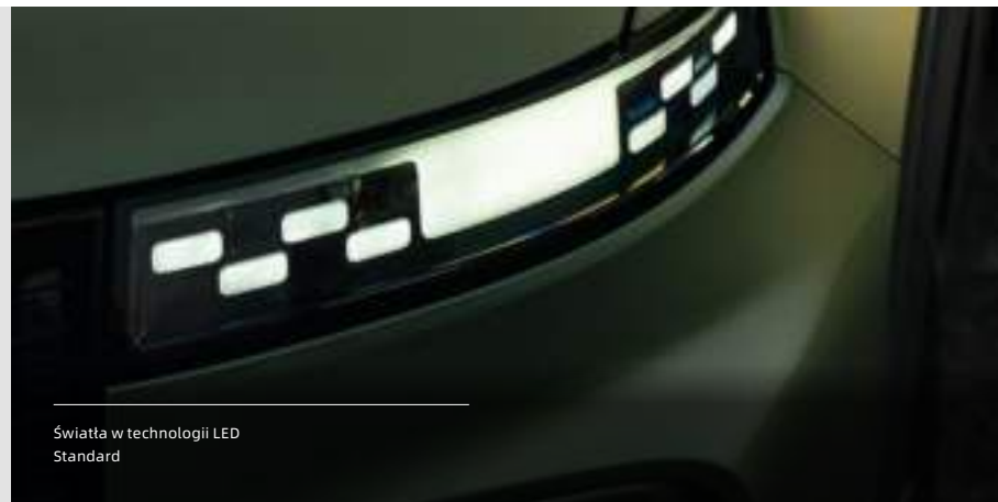
Światła w technologii LED Standard