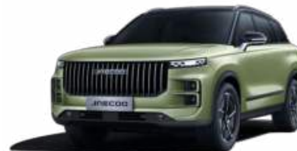
MODEL GREEN Z CZARNYM DACHEM (ZM)