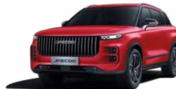
BLOOD RED (NL) - LAKIER METALIZOWANY