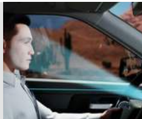
System monitorowania uwagi kierowcy (DMS)