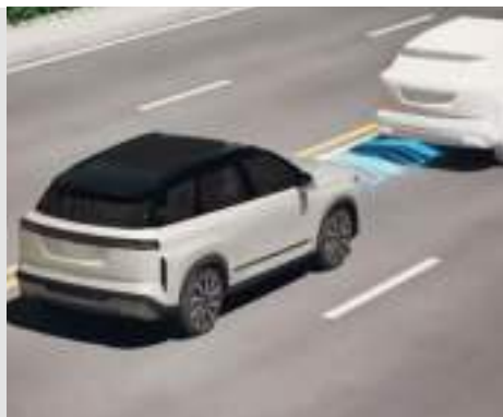
System ostrzegania przed kolizją z przodu (FCW)