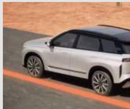
System ostrzegający o niezamierzonej zmianie pasa ruchu (LDW)