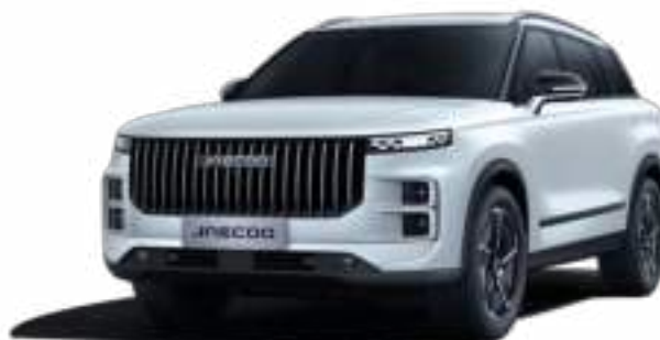
KHAKI WHITE (BW) - LAKIER PERŁOWY