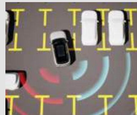
System ostrzegania przed kolizją podczas cofania (RCW)