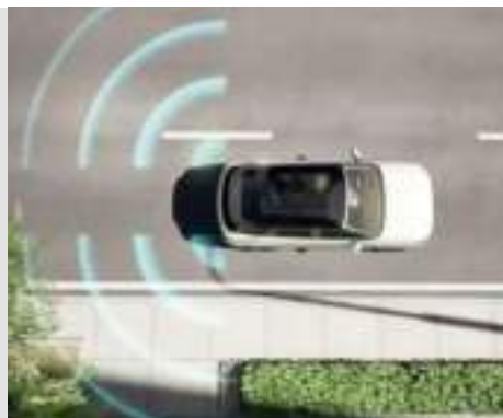
System monitorowania martwego pola widzenia w lusterkach (BSD)