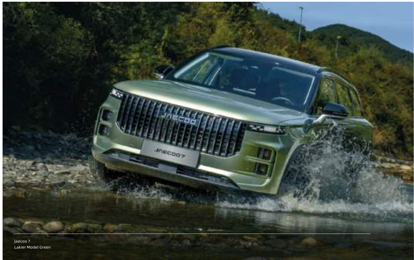
Jaecoo 7 Lakier Model Green

Niezależnie jaką wersję wybierzesz, zawsze wyposażona jest ona w dwusprzęgłową, automatyczną skrzynię biegów o siedmiu przełożeniach.