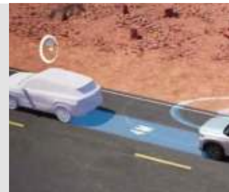
Tempomat adaptacyjny z funkcją utrzymywania na pasie ruchu (ACC)