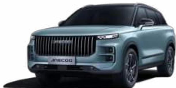
OLIVE GRAY Z CZARNYM DACHEM (ZK)