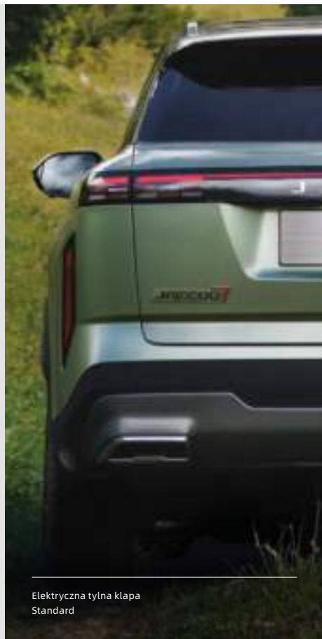
Elektryczna tylna kłapa Standard