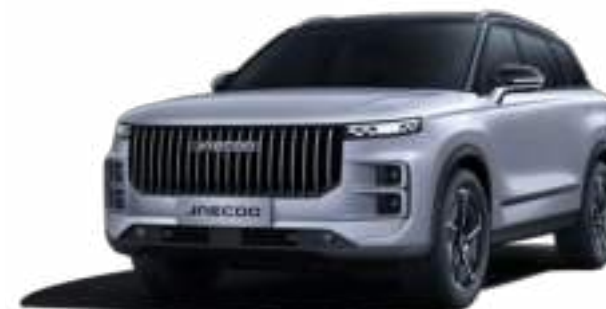
MOONLIGHT SILVER Z CZARNYM DACHEM (ZN)