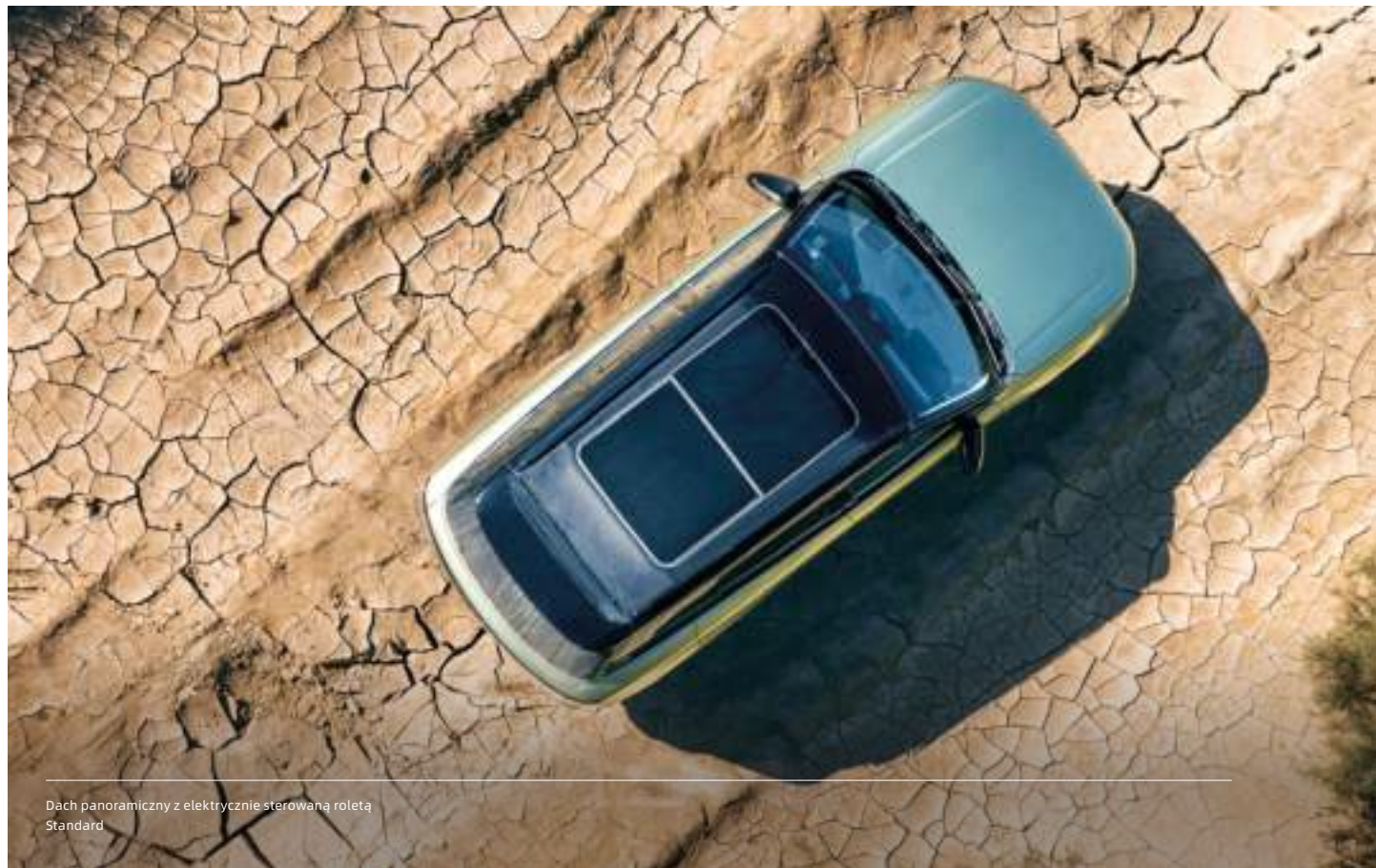
Dach panoramiczny z elektrycznie sterowaną roletą Standard

Każdy tryb został zaprojektowany, aby poprawić osiągi pojazdu i wrażenia z jazdy w różnych warunkach, zapewniając optymalną kontrolę i wydajność.