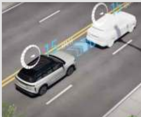
System informujący o odjechaniu pojazdu poprzedzającego