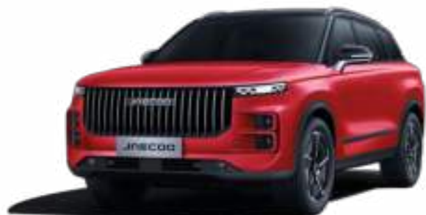
BLOOD RED Z CZARNYM DACHEM (ZF)