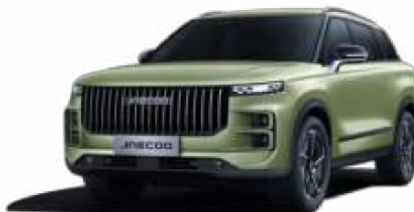
MODEL GREEN (SP) - LAKIER METALIZOWANY