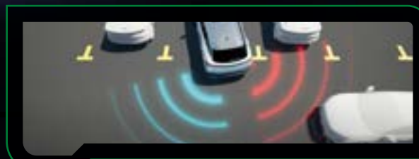
System ostrzegania przed kolizją podczas cofania

Omoda E5 - tak jak wersja z napędem spalinowym wyposażona jest w pełen zestaw zaawansowanych systemów od kontroli pasa ruchu, przez monitor martwego pola, po inteligentny tempomat adaptacyjny.