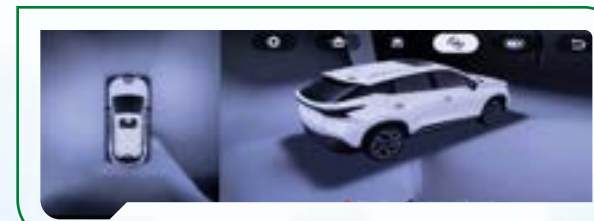
System kamer 540°

System kamer o kącie widzenia 540° uruchamia się automatycznie podczas cofania. Asystent parkowania obejmuje również czujniki parkowania z przodu i z tyłu oraz klasyczną kamerę cofania.