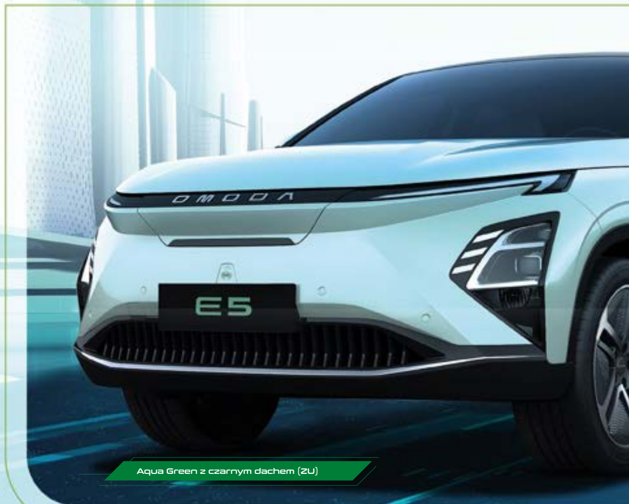
Aqua Green z czarnym dachem (ZU)