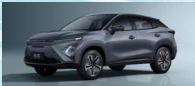
Phantom Gray (GV)