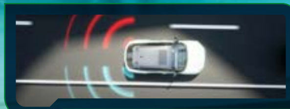
System monitorowania martwego pola