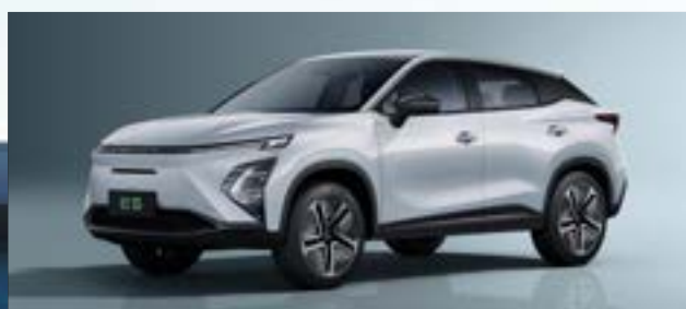
Khaki White (BW)