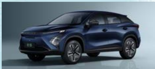
Midnight Blue (WB)