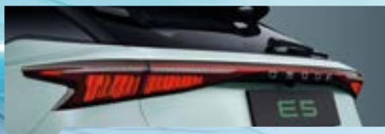
Tylne światła w technologii LED