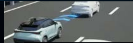
Tempomat adaptacyjny z funkcją utrzymywania na pasie ruchu (ACC)