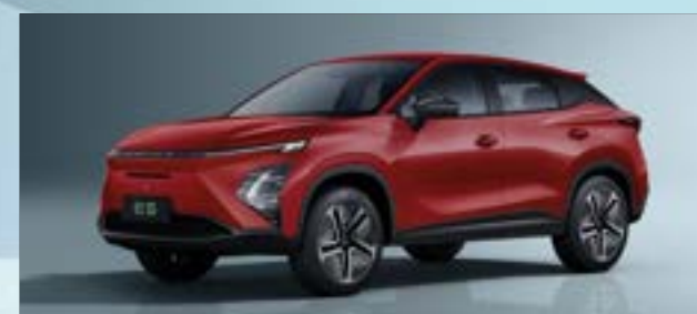
Blood Red (NL)