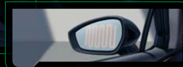
Elektrycznie składane, sterowane i podgrzewane lusterka