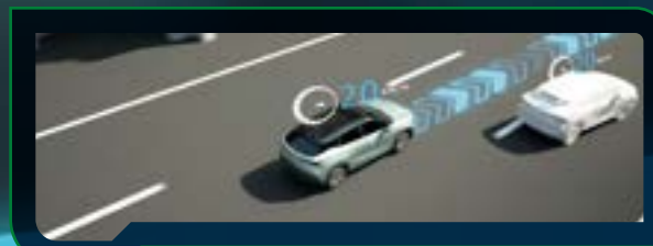
Asystent jazdy w korku