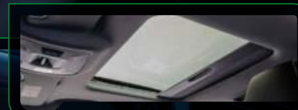
Otwierane okno dachowe