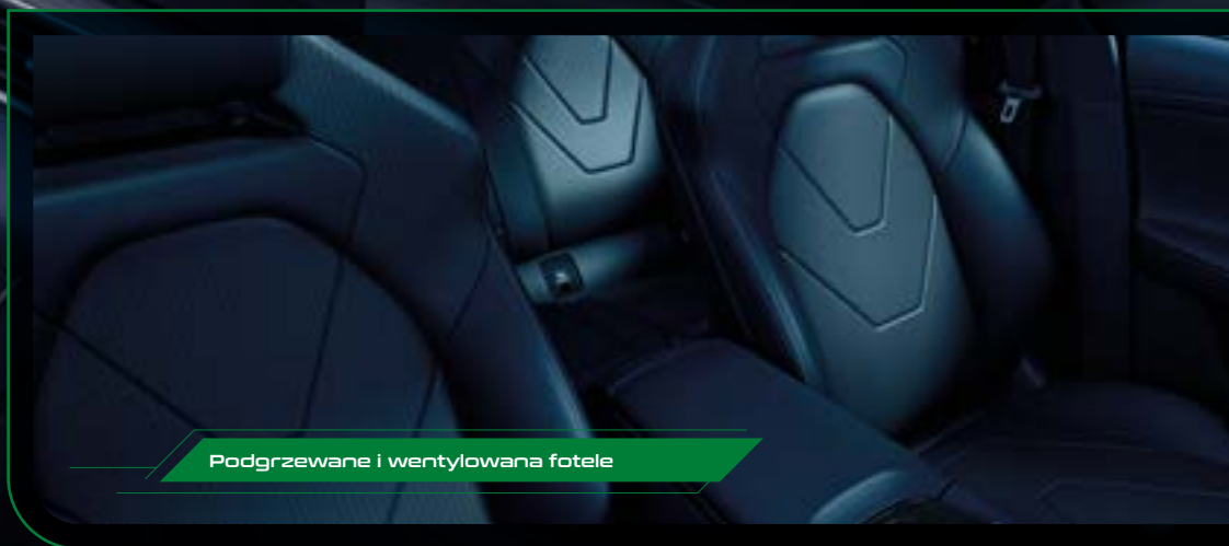
Podgrzewane i wentylowana fotele