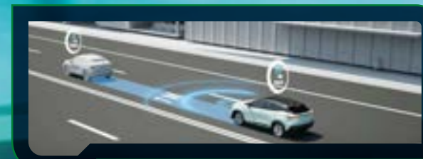
Inteligentny system unikania kolizji (ICS)