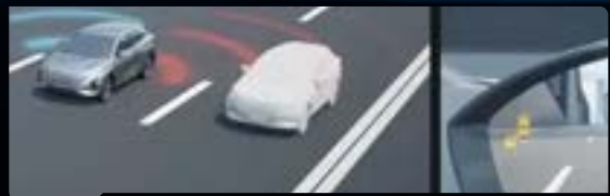
System monitorowania martwego pola