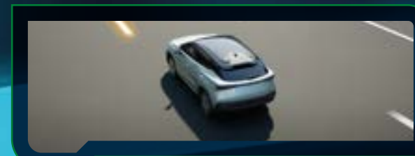
System ostrzegający o niezamierzonej zmianie pasa ruchu (LDW)