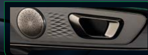
System audio SONY z 8. głośnikami

System obsługi głosowej Hello OMODA, za pomocą którego pasażerowie mogą m. in. otworzyć okna, okno dachowe, ustawić temperaturę układu klimatyzacji. Wyjątkową atmosferę kabiny podkreśli system oświetlenia ambientowego, umożliwiający ustawienie ulubionego koloru podświetlenia wnętrza.