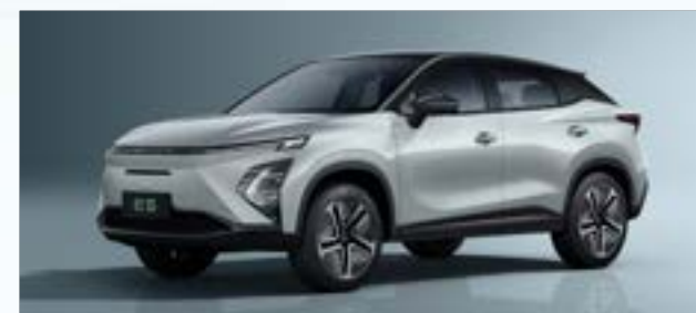
Aviation Silver z czarnym dachem (X4)