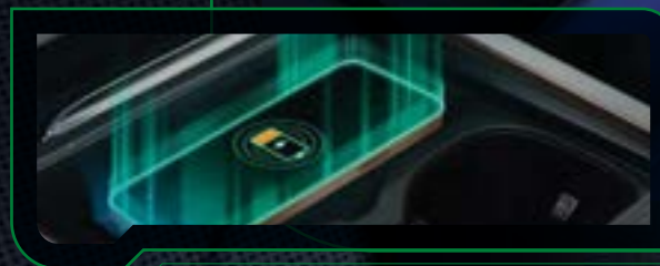
Ładowarka indukcyjna o mocy 50W