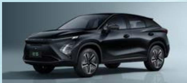
Carbon Black (CL)