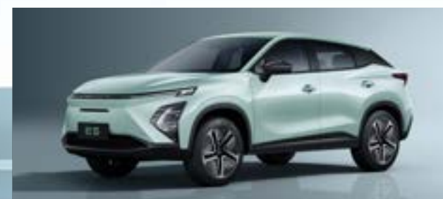
Aqua Green (SK)