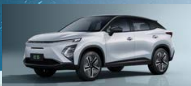
Khaki White z czarnym dachem (ZE)